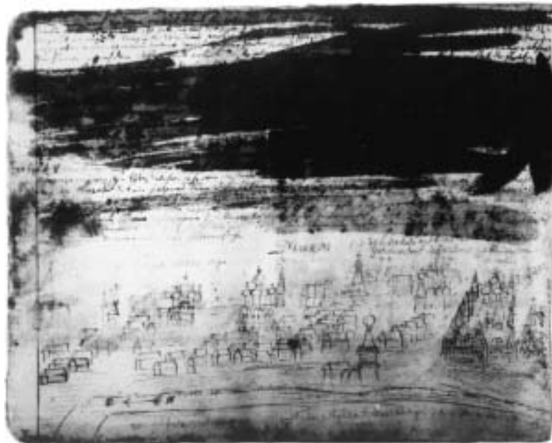
Sloane 2923, fol. 130r (oben) und fol. 131v (unten)